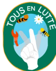
Ebauche de logo Démarche "Tous en lutte"